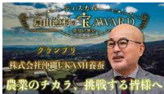
取組紹介のPR動画(グランプリ地区)