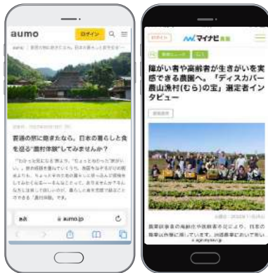
メディア媒体(アウモ、マイナビ)での記事掲載