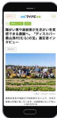
メディア媒体(アウモ、マイナビ)での記事掲載